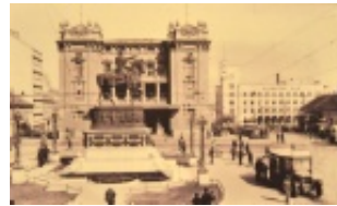
Beogradske priče: Seoba Narodnog