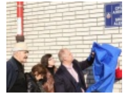
Postavljena tabla nazivom ulice Sr