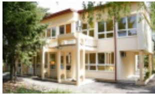
Ulaze u obdanište samo se karticom