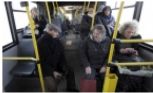
Autobus 605 staje na svakom ćošku