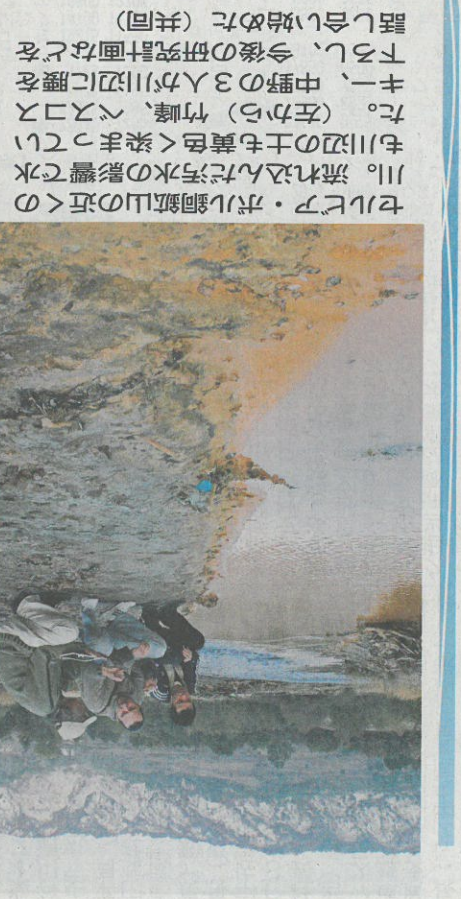
米軍前哨の国府警備隊へ準備態勢を整える。写真: 米軍前哨の国府警備隊へ準備態勢を整える。